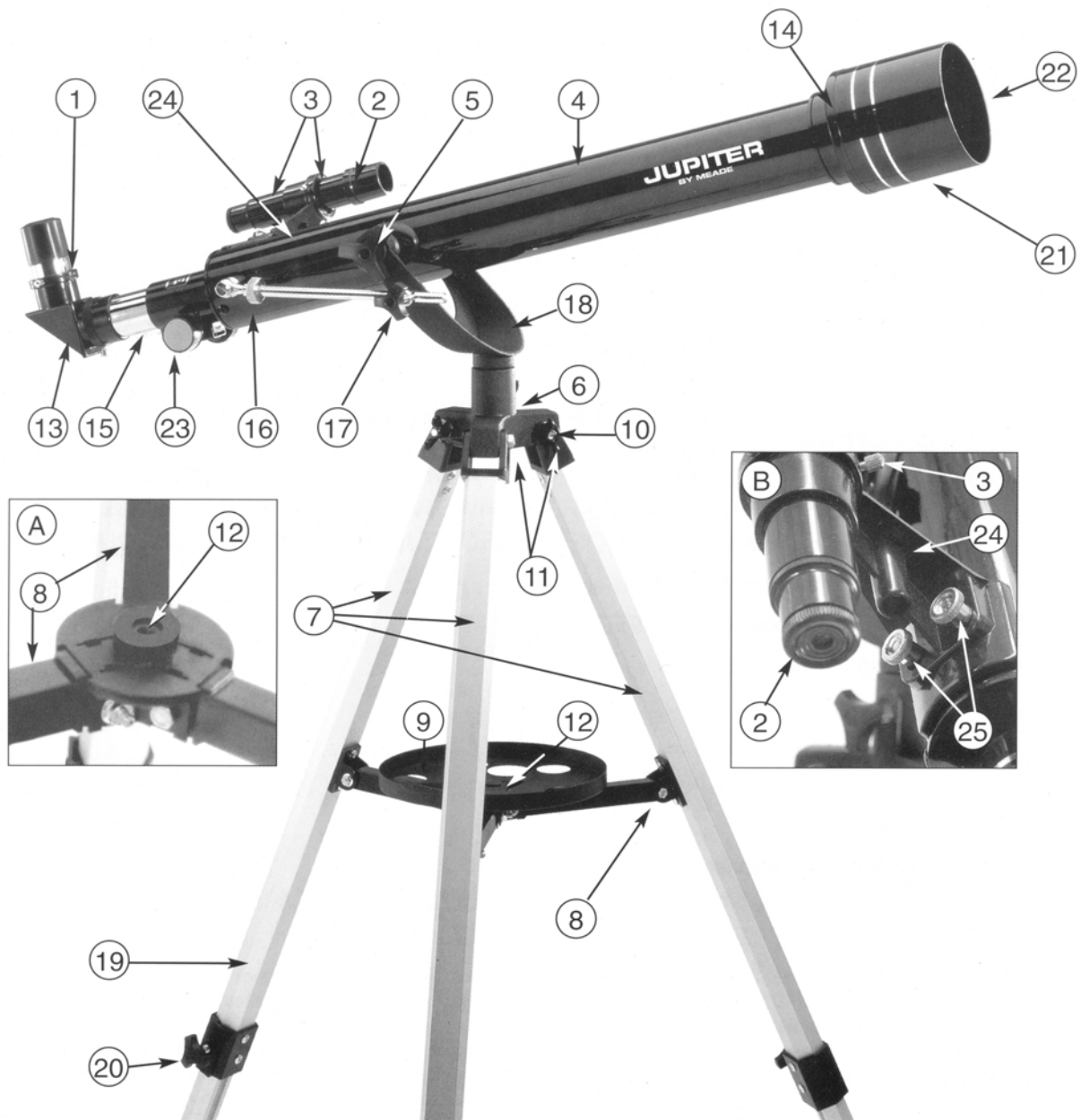
FIGURA 1: JUPITER 60AZ-A TELESCOPIO REFRACTOR ALTACIMUTAL 2.4"

Inserto A: Montaje de Charola; Inserto B: Montaje del Buscador