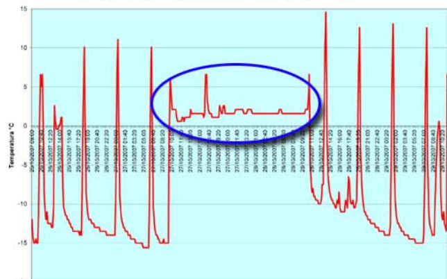
Registro de Temp. en Congelador en el Restaurant

Se observa un comportamiento uniforme durante los tres días de la prueba. Las temperatura varía principalmente de 4.5° a 7.5°C con algunos picos que llegan hasta los 9.5°C. La observación del gerente del lugar es que estos valores se pueden considerar dentro de rango.